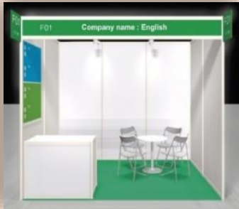
Gian hàng tiêu chuẩn (giá niêm yết: 38,500,000VND/gian)